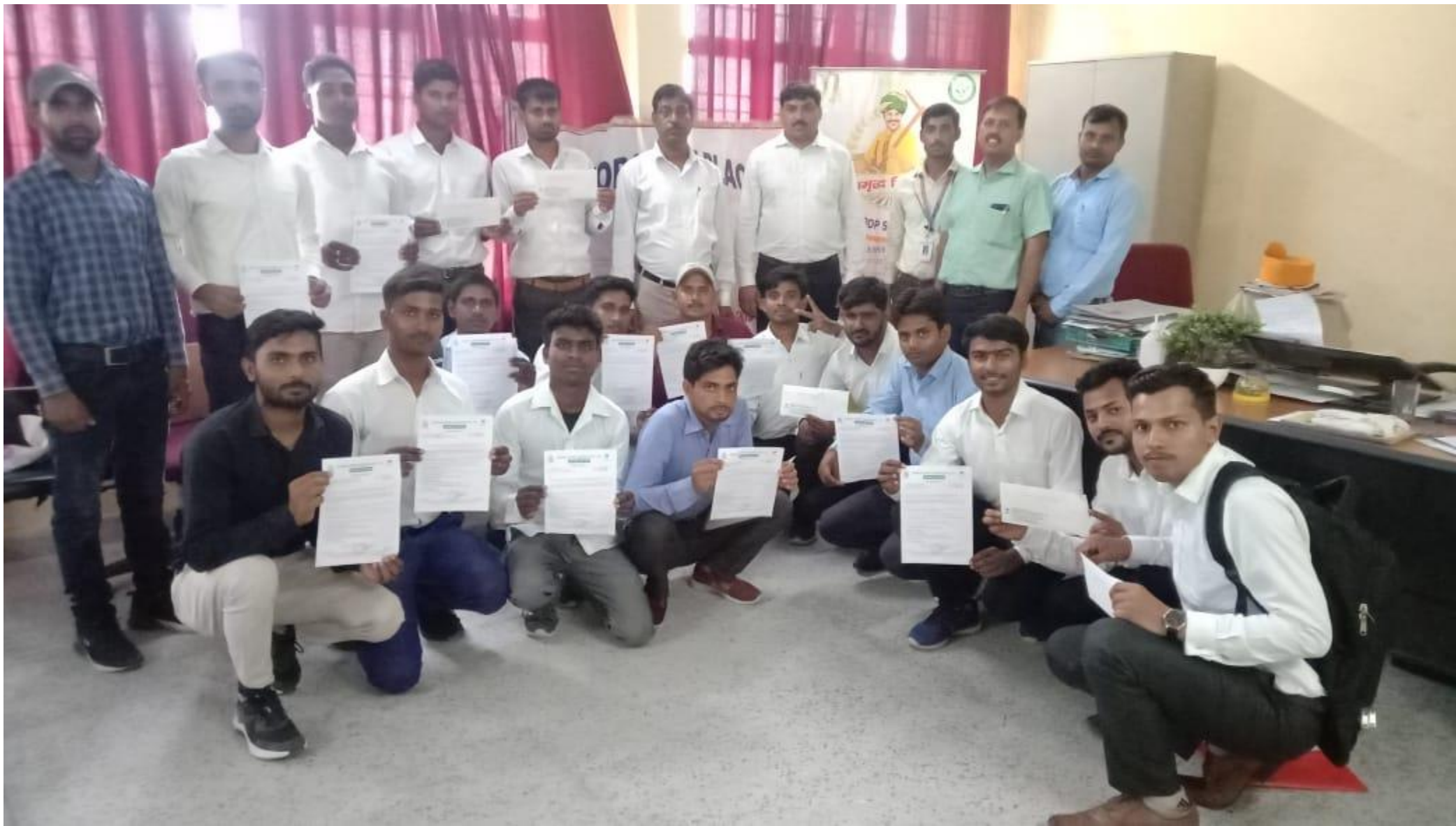
Campus placement of students by Zeneva Crops Science Pvt. Ltd., Lucknow on 27-08-2021