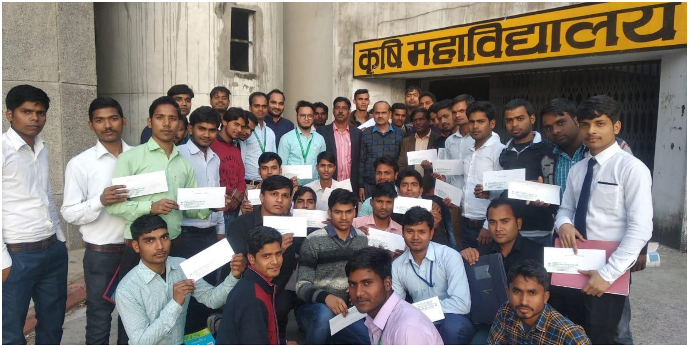
Selected students after campus interview by Zeneva Crops Science Pvt. Ltd., Lucknow on 17-02-2019