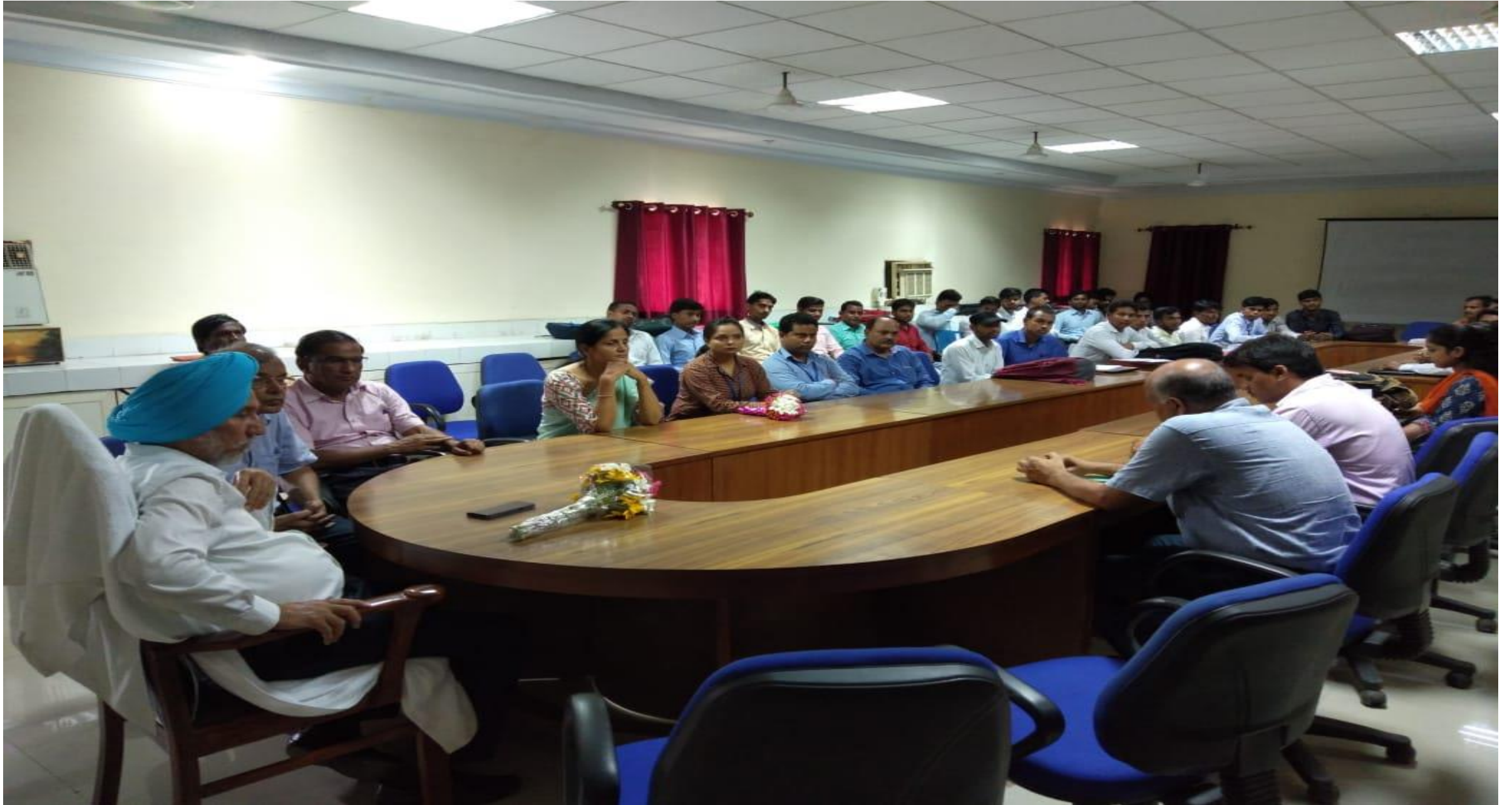
Placement drive by the university placement cell on 10.05.19 for the posts of Assistant Professors in Bhavdiya Group of Institutes