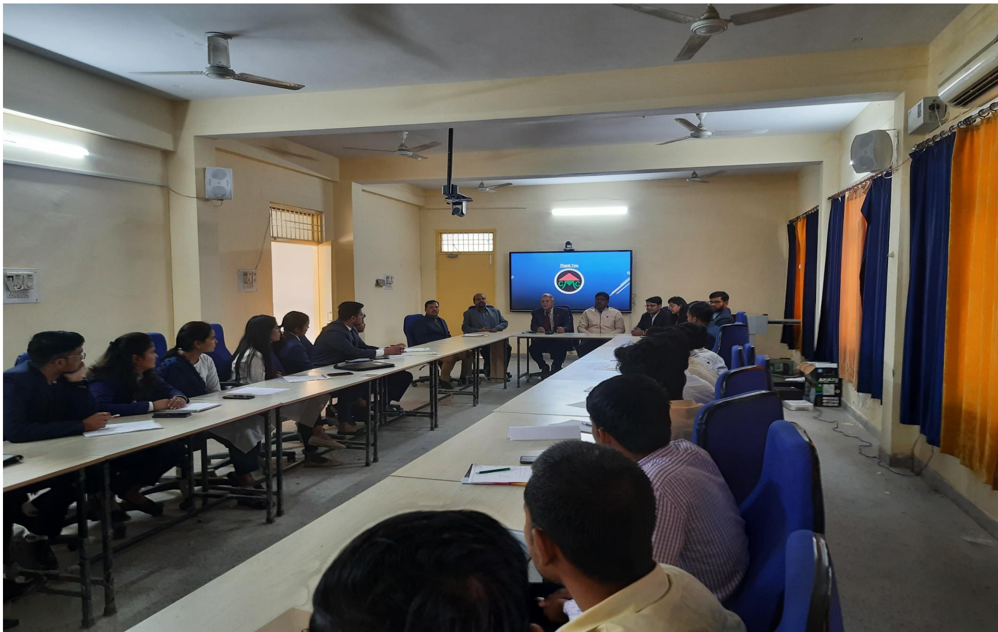
Campus interview for student of Master in Agribusiness by Casphor Microfinance PVT LTD on 19 February, 2022