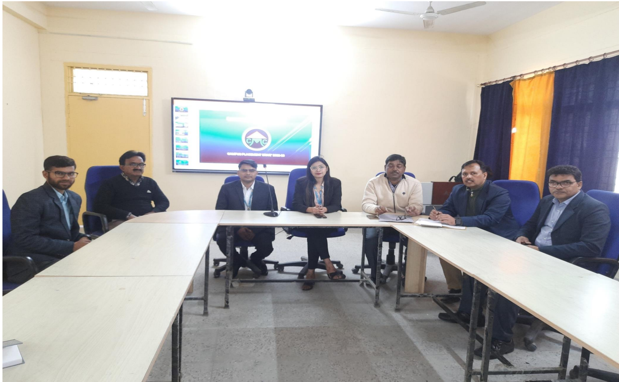
Campus interview for student of Master in Agribusiness by Casphor Microfinance PVT LTD on 19 February, 2022