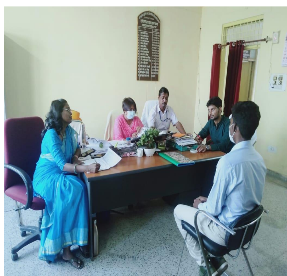
Campus interview for placement of students by UPSRLM, Lucknow on 18-11-2021