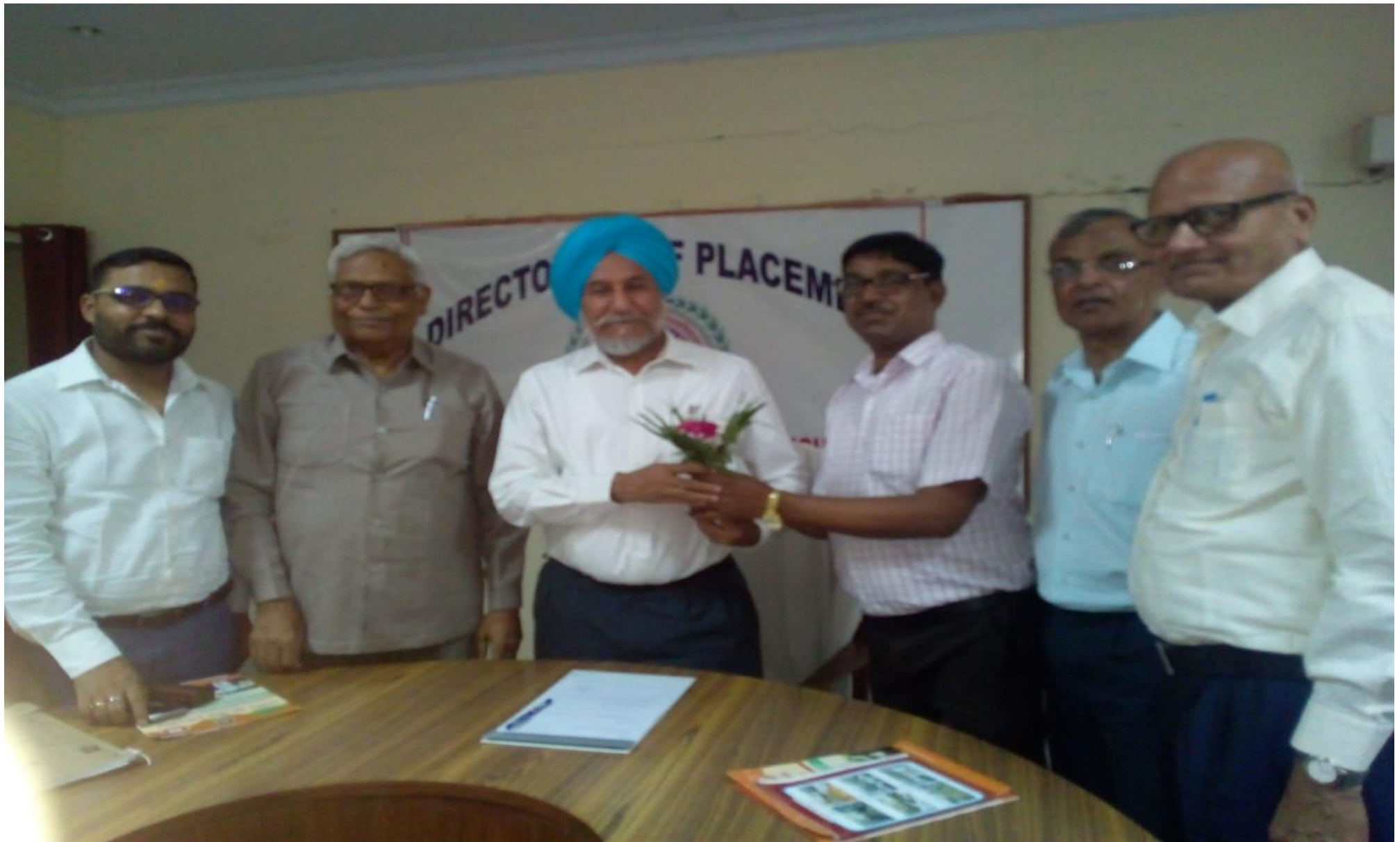
Experts of Bhavdiya Group of Institutes in the placement cell of the university on 10.05.19 for the placement drive for posts of Assistant Professors