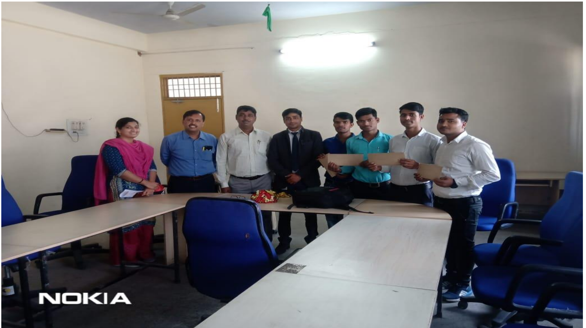
Placement of students by Radhika Biotechnology Pvt Ltd on 27 Feb. 2021